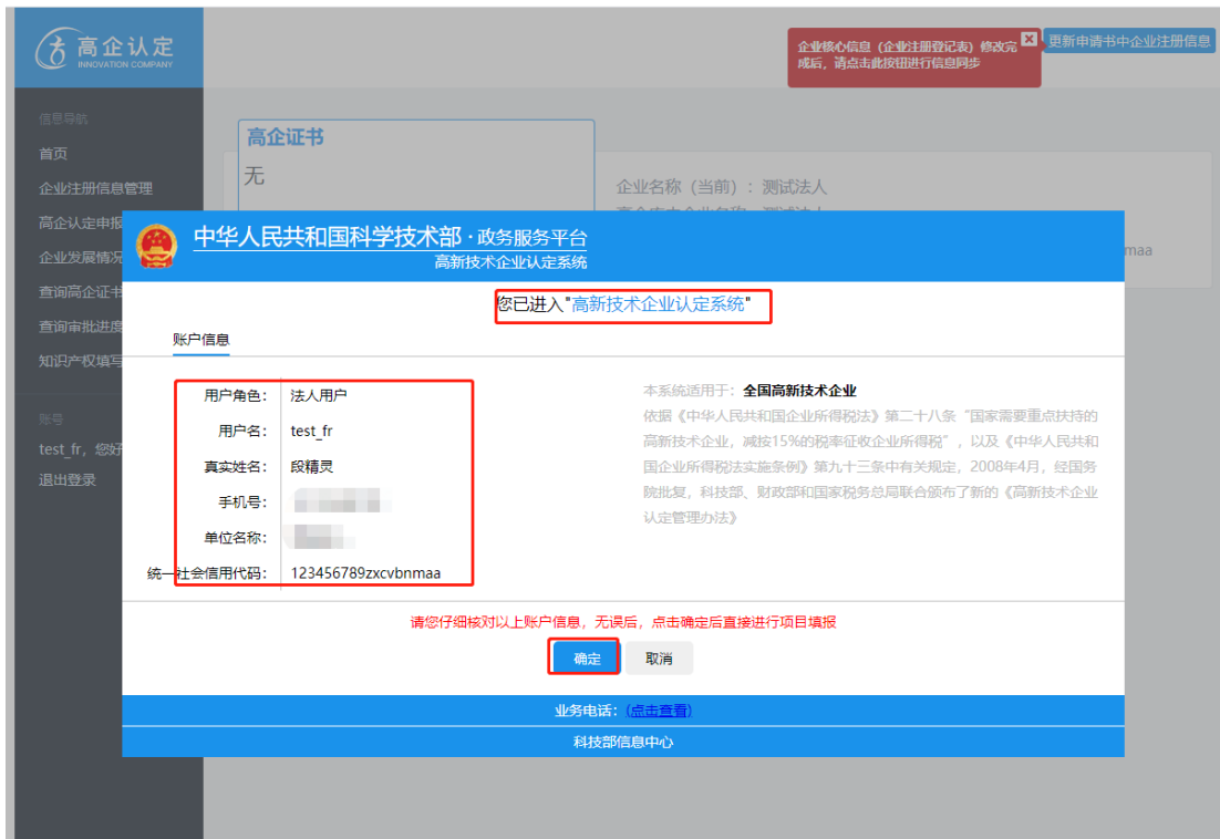
高新技术企业认定系统